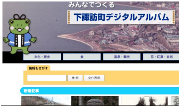
下諏訪町アーカイブ