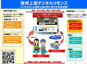
信州上田デジタルマップ