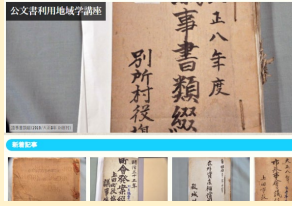
公文書利用地域学講座