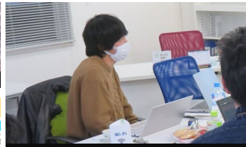
クラウドサービス開発

大学の学びを面白く！ 前川プロジェクト研究は、地域と学生の興味の マッチングで課題を探り進めます。