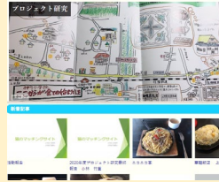
前川ゼミ2020各自の成果

2020年度はデジタルコモンズ（「信州上田デジタルマップ」等）のメディア環境デザインを進めました。あなたの目線に立った課題の提起、具体策の実践が何よりも社会から求められています。