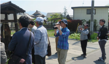
上田市西部地域アーカイブ