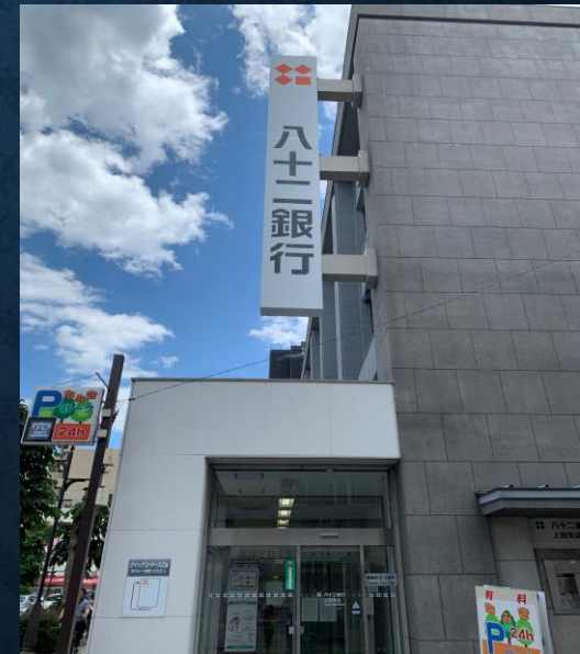
写真:八十二銀行上田支店(旧第十九国立銀行)

明治・大正期の金融に関する資料、年表を当たり、それによって当時の上田が全国的にどれぐらいの規模で経済的に栄えていたのかを調べる。